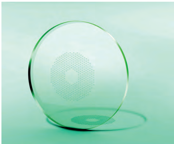
Abb. 1: Auf der Vorderfläche des MyoSmart befinden sich zahlreiche kleine, kreisförmige Linsensegmente mit einer Brechkraft von jeweils +3,5 dpt. Diese kleinen Linsensegmente liegen in einer ringförmigen Zone um die Glasmitte herum. Anmerkung: In diesem Bild wurden die kleinen Zusatzlinsen vom Autor durch eine Kontrastverstärkung mit Photoshop besser sichtbar gemacht.