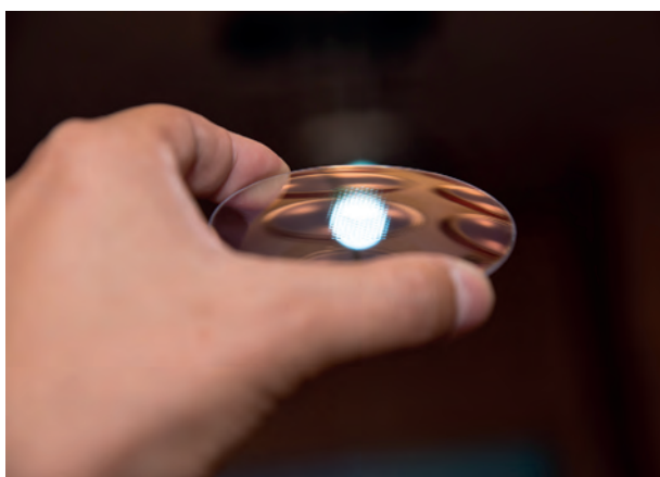
Abb. 2: Auch bei spiegelnder Beleuchtung kann man die kleinen Linsensegmente erkennen.