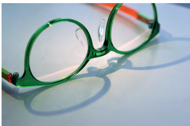
Abb. 3: Wenn die Gläser in eine Fassung eingearbeitet sind und getragen werden, sind die Linsensegmente fast unsichtbar.

sich in einem ringförmigen Bereich außerhalb der Glasmitte zahlreiche kleine Linsensegmente auf der Vorderfläche des Glases. Jedes einzelne dieser Linsensegmente hat eine Brechkraft von +3,5 Dioptrien. Wenn man mit dem Finger über die Vorderfläche des Glases streicht, kann man diese kleinen Linsen fühlen. In einem zentralen Bereich mit einem Durchmesser von 9,4 mm befinden sich keine Zusatzlinsen. Dort ist eine freie optische Zone, die für ein klares und deutliches foveolares Sehen sorgt. Die kleinen kugelsegmentförmigen Linsen und die zentrale klare Zone kann man auf dem Foto in Abbildung 1 deutlich erkennen.